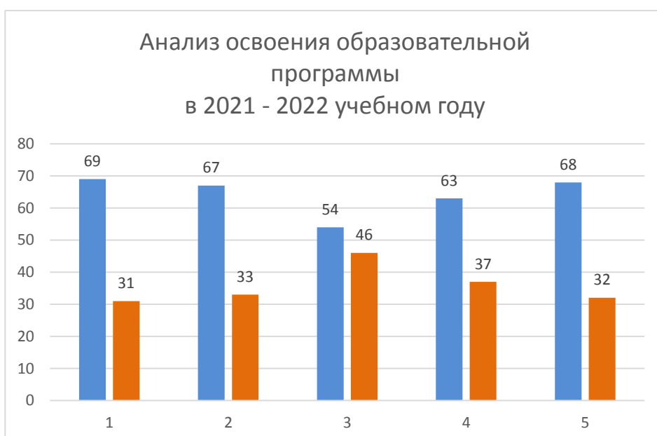
Сводная таблица освоения образовательной программы воспитанниками подготовительной группы МБДОУ № 195 за 2021 - 2022 учебный год.